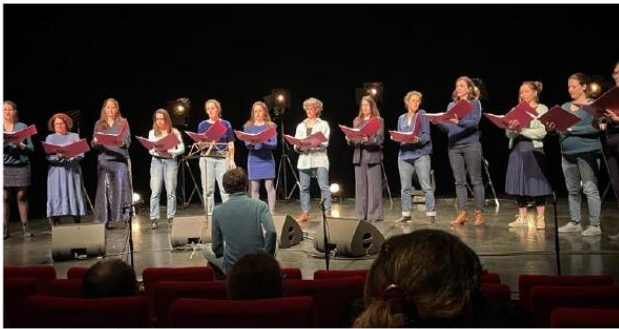
L'ensemble vocal Plurielles a donné le premier spectacle de la soirée.

La soirée est en effet allée du débutant au confirmé, avec d'abord un atelier d'initiation