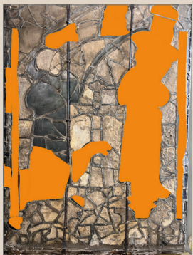
Pièces de restauration en orange

Les vitraux comportent des altérations physiques (casse, plombs de casse, etc.) du verre support, ainsi que des altérations chimiques (dégradation des verres potassiques particulièrement fragiles à l'eau et aux réactions chimiques en chaîne associées aux polluants atmosphériques). Des fragilités de la couche picturale ont entraîné des lacunes de peinture et la pose sur certains verres d'une grossière patine à froid qu'il faudra choisir d'enlever ou d'estomper tout en considérant l'harmonie globale des vitraux.