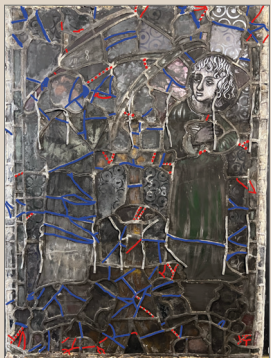
132 plombs de casse, 67 casses (y compris celles cachées par des ailes de plomb).