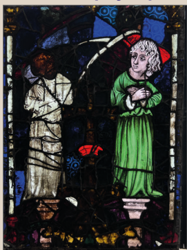
Panneau B3 de la baie 6 / lumière transmise et réfléchiée face interne / lumière réfléchiée face externe.